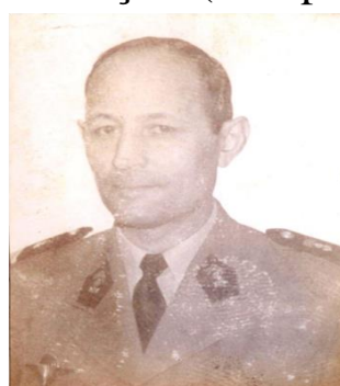
•CBA FOURCAUD (1983-1985)