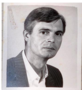
•CES Robert VIGNO (1987-1988)